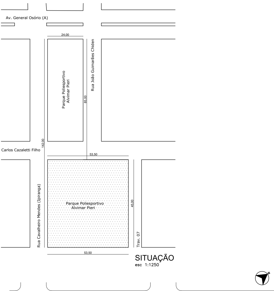
SITUAÇÃO esc 1:1250