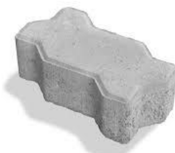
Figura 3 - Modelo de bloco intertravado

A pavimentação será executada com bloco de concreto intertravado, de resistência mínima de 35 Mpa, conforme Figura 3.