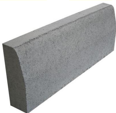
Figura 1- Modelo de meio-fio

O meio fio também denominado Guia, será em concreto simples resistência mínima à compressão 20 Mpa com seção trapezoidal nas dimensões: comprimento 1,00m, largura da face superior 0,12m, largura da face inferior 0,15m, altura 0,30m, conforme Figura 1.