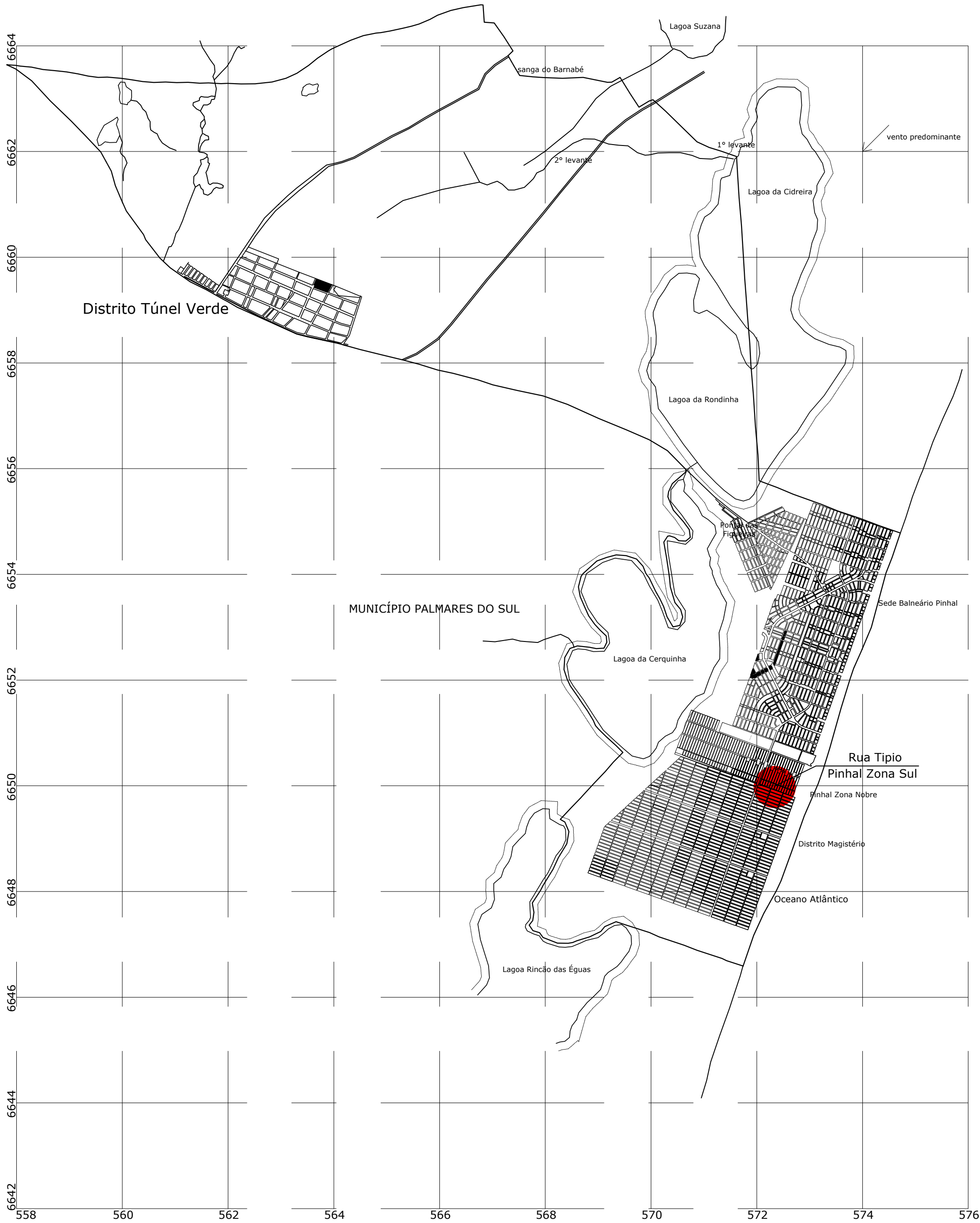
Situação Geral Sem escala